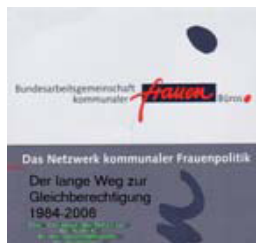
Der lange Weg zur Gleichberechtigung, 8,00 €

Bestellung über die Geschäftsstelle der BAG Erstellt für die Bundeskonferenz der BAG in Frankfurt am Main 2008