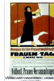
Wie wir wurden, was wir sind, 13,00 €