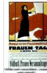
Wie wir wurden, was wir sind, 13,00 €