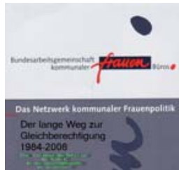
Der lange Weg zur Gleichberechtigung, 8,00 €

Bestellung über die Geschäftsstelle der BAG Erstellt für die Bundeskonferenz der BAG in Frankfurt am Main 2008